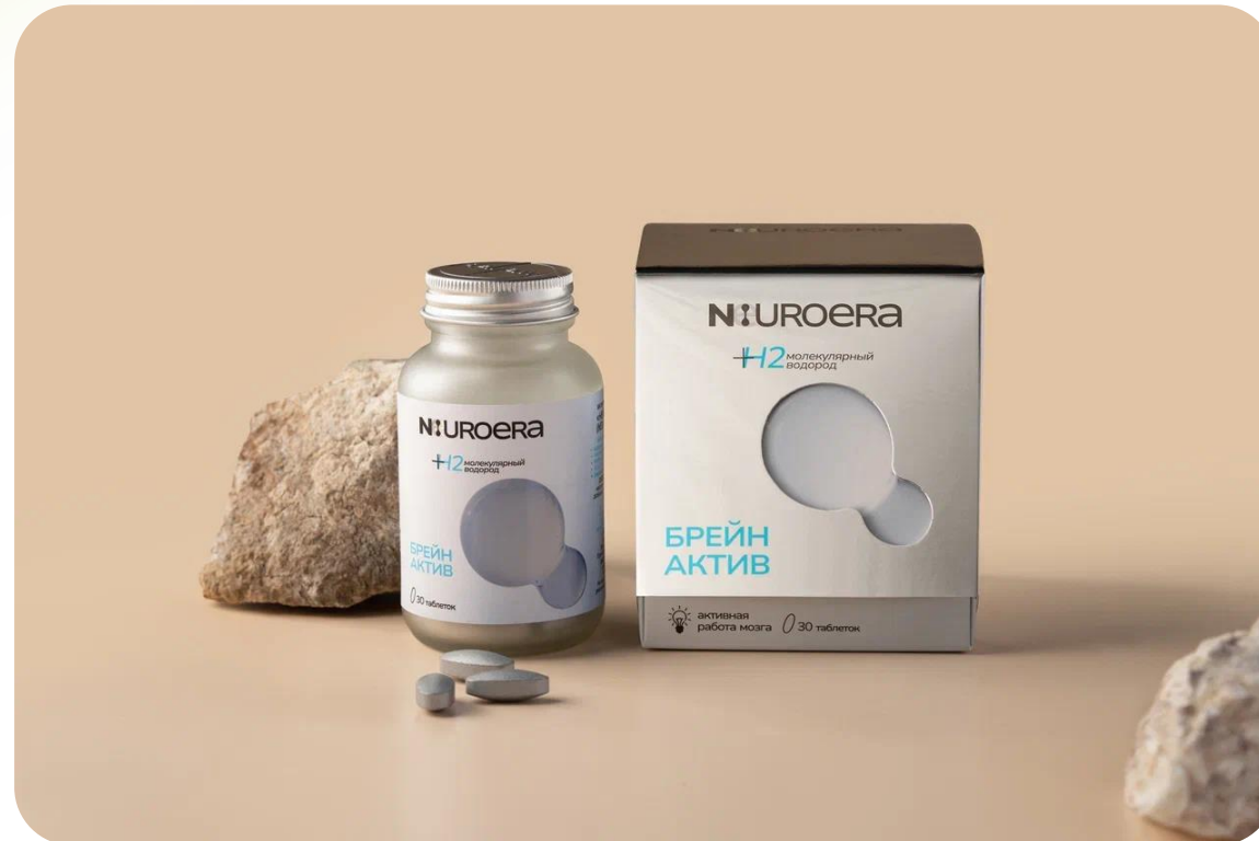
БАД «НЕЙРОЭРА БРЕЙН АКТИВ» 30 таблеток