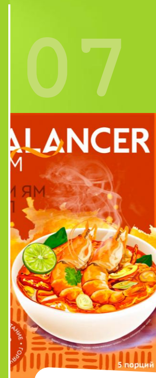
BALANCER SLIM Коктейль со вкусом «Тайский суп Том ям»