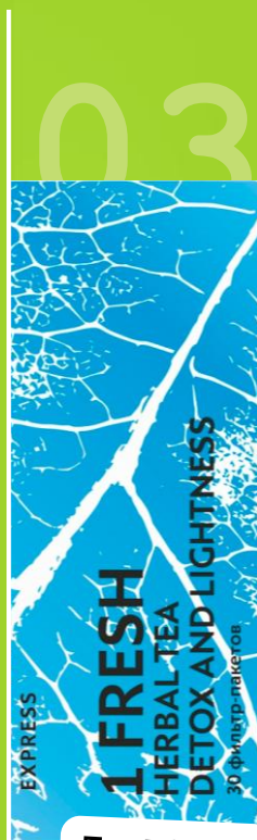
TeaVital1 Express Fresh 1