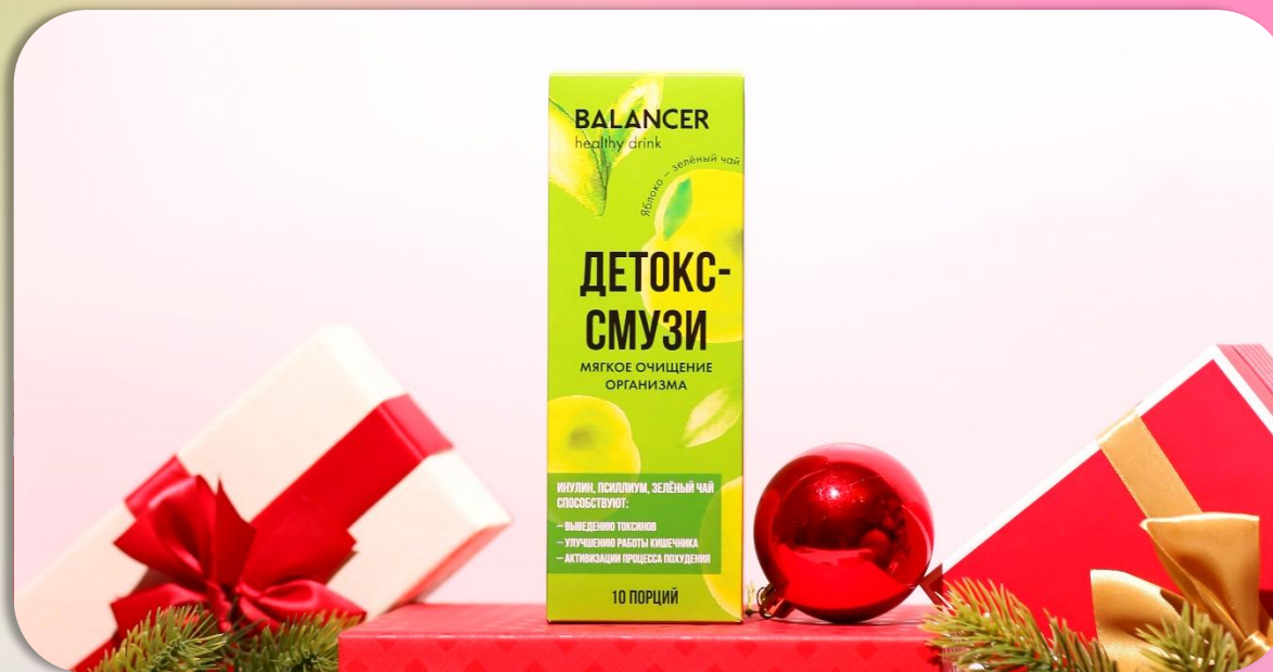
BALANCER Детокс-смузи «Яблоко-зелёный чай», 10 стиков