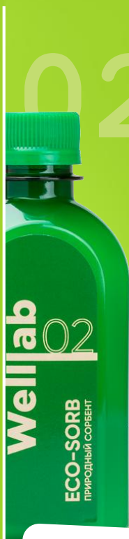
Природный сорбент Welllab liquid ECO-SORB