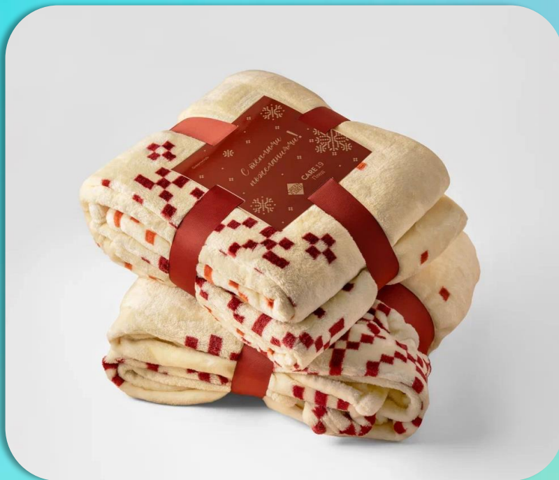
GREEN FIBER CARE 19 Плед бежевый