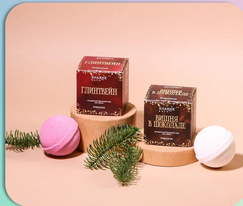
SHARME BATH Шары для ванны «Глнтвейн» и «Вишня в шоколаде», 200 г