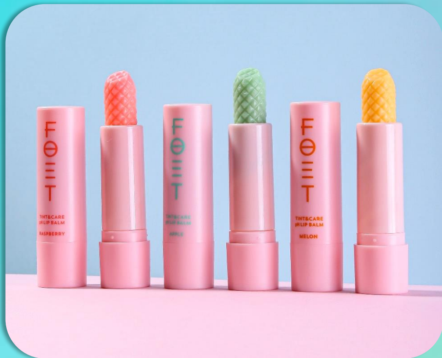
FOET pH Бальзам для губ «Малина», «Дыня», «Яблоко», 4,2 г