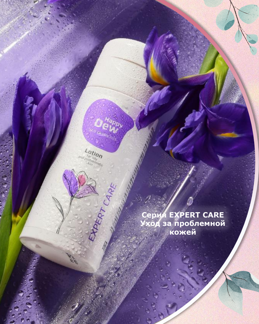
Серия EXPERT CARE Уход за проблемной кожей