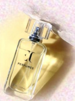
ENJOY CARE Духи женские, EC CLASSIC 170, 50 мл