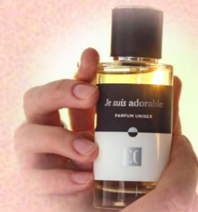
ENJOY CARE Духи унисекс, EC LUXE 324, 50 мл