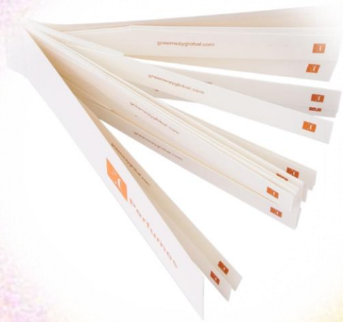
Блоттер для тестирования парфюмерии Enjoy Care, 30 шт