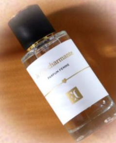
ENJOY CARE Духи женские, EC LUXE 104, 50 мл