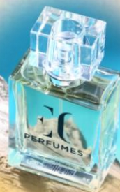
ENJOY CARE Духи мужские, EC CLASSIC 299, 50 мл