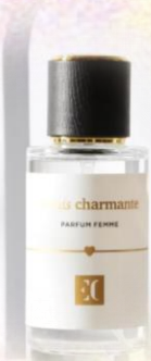
ENJOY CARE Духи женские, EC LUXE 105, 50 мл