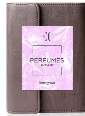
Набор пробников Enjoy Care в органайзере, 44 шт