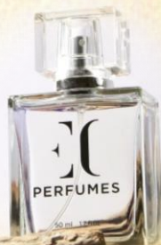
ENJOY CARE Духи мужские, EC CLASSIC 275, 50 мл