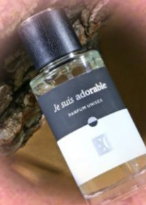
ENJOY CARE Духи унисекс, EC LUXE 326, 50 мл