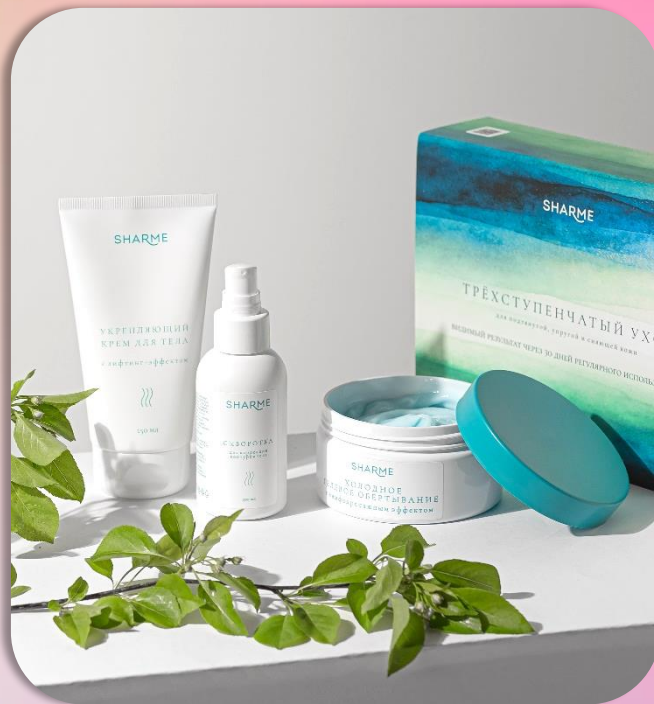
SHARME Трёхступенчатый уход для подтянутой, упругой и сияющей кожи