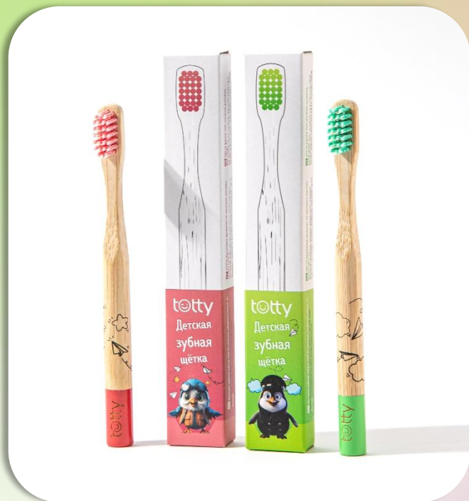
TOTTY Детские зубные щётки 3+, мягкие, красная и зелёная