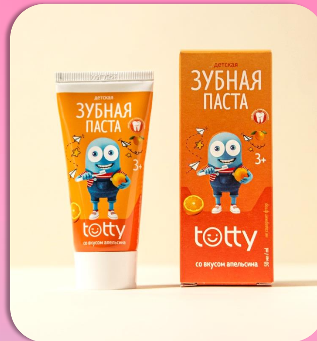
TOTTY Детская зубная паста со вкусом апельсина 3+, 50 мл