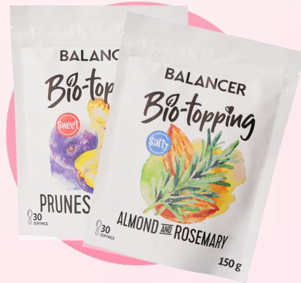
Клетчатка BALANCER Bio-topping