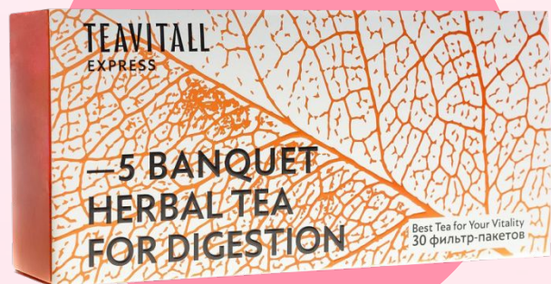
Функциональные напитки TEAVITALL